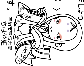
宇治市宣伝大使 ちはや姫